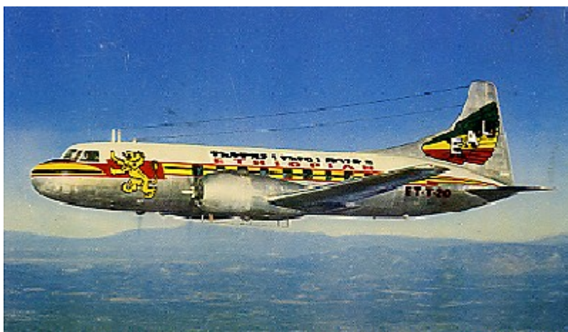
Δικινητήριο αεροσκάφος της ETHIOPIAN AIRLINES

Όπου εκτός από μία σύντομη ιστορική ανασκόπηση της Αιθιοπίας περιέχονται λαογραφικές πληροφορίες από πραγματικές πηγές για το ταξίδι του ήρωά μας εμπλουτισμένες με πληροφορίες περί αφρικανικής σαβάνας, φυτοφάγων θηλαστικών, πτηνών και βαβουίνων, καθώς και περί της αδιάσειστης δυνατότητας να αναπτυχθεί μια ιδιαίτερη σχέση μαζί τους, πάντα βασισμένη - στα κατά του Λι λεγόμενα, - χιούμορ και τρυφερότητα.