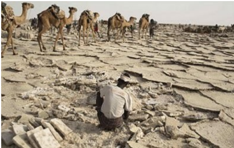
Καραβάνι διανύει έναν αρχαίο δρόμο του αλατιού.

- Εκείνη τη φορά είχαμε βάλει καύσιμα που δεν ήταν καθαρά. Που να ξέρουμε τι βενζίνη μας πουλούσε το κάθε βενζινάδικο που συναντούσαμε στο δρόμο. Μετά από λίγη ώρα, η μηχανή μπουκώσε και σταμάτησε να δουλεύει ο ένας κινητήρας. Που σημαίνει πως θα έπρεπε να βρούμε οπωσδήποτε άλλα καύσιμα και να καθαρίσουμε τα μπουζιά. Αρχίσαμε να χάνουμε ύψος, φοβόμουν μήπως σταματήσει και ο άλλος κινητήρας. Ο παππούς σου τότε αντί να θορυβηθεί, άρχισε να τραγουδάει μαν άρια. Χάνουμε ύψος του φώναζα. Θα τρακάρουμε στα βουνά. Στα δένδρα. Πιάσε τον ασύρματο. Αυτός δεν χαμπάριαζε τίποτα. Συνέχισε να τραγουδάει, με το γνωστό του ύφος. Το αεροπλάνο περνούσε ανάμεσα από τις χαράδρες, μόλις που έβλεπε τις κορυφές των δένδρων, και εγώ σκεπτόμουν τη θεία σου που εξ' αιτίας αυτής επιπολαιότητας θα την άφηνα μόνη στον κόσμο.