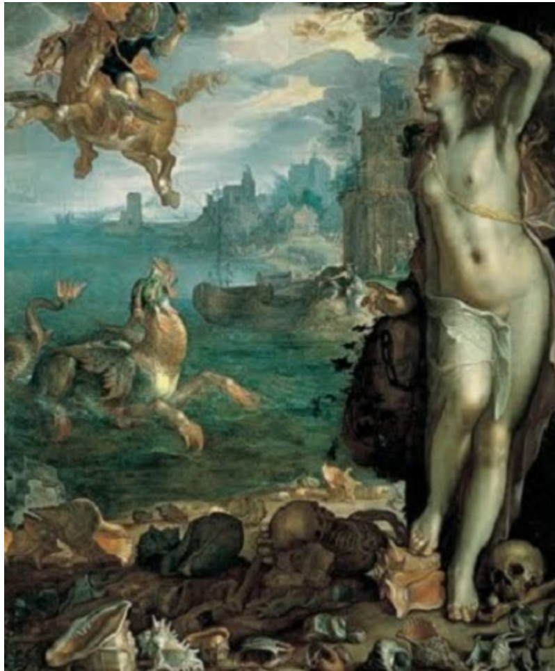
Η Ανδρομέδα, κόρη του βασιλιά της Αιθιοπίας Κηφέα

- 'Άστα να πάνε αγόρι μου. Όσο παραμένει ο άνθρωπος άπληστος τόσο η αδιαφορία η ντροπή και η σκληρότητα θα μαστίζουν τον πλανήτη. Όσο αρνείται να γνωρίσει τη θεία του καταγωγή, ο μικρός του εαυτούλης θα είναι και ο μεγαλύτερος του τύραννος'.