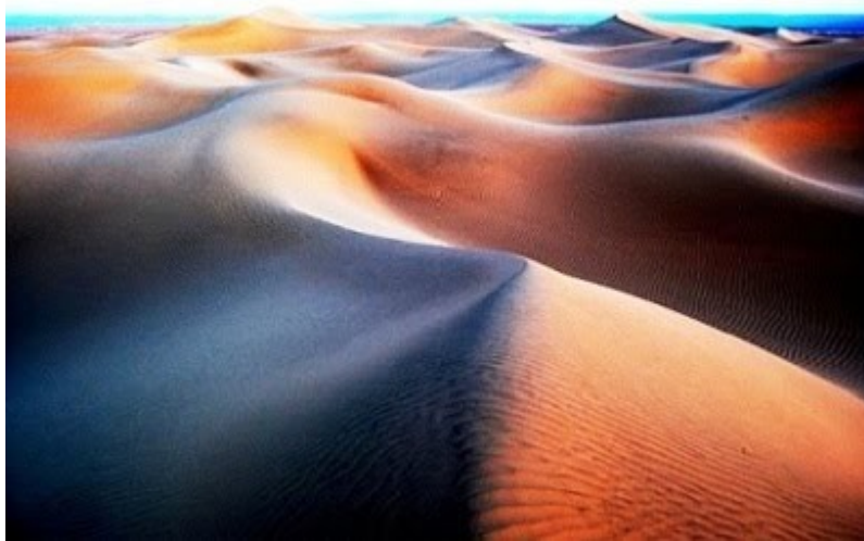
Οι αμμόλοφοι της ερήμου.