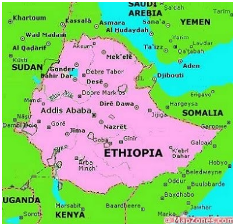
Ο χάρτης της Αιθιοπίας, με τα κράτη που συνορεύει.

Μια πρώτη γνωριμία με την παιδική ηλικία του ήρωά μας όπου εν συντομία αναφέρονται οι μικρές ιδιομορφίες του Λι, αλλά και οι πλέον αξιωματικότερες απόψεις του .