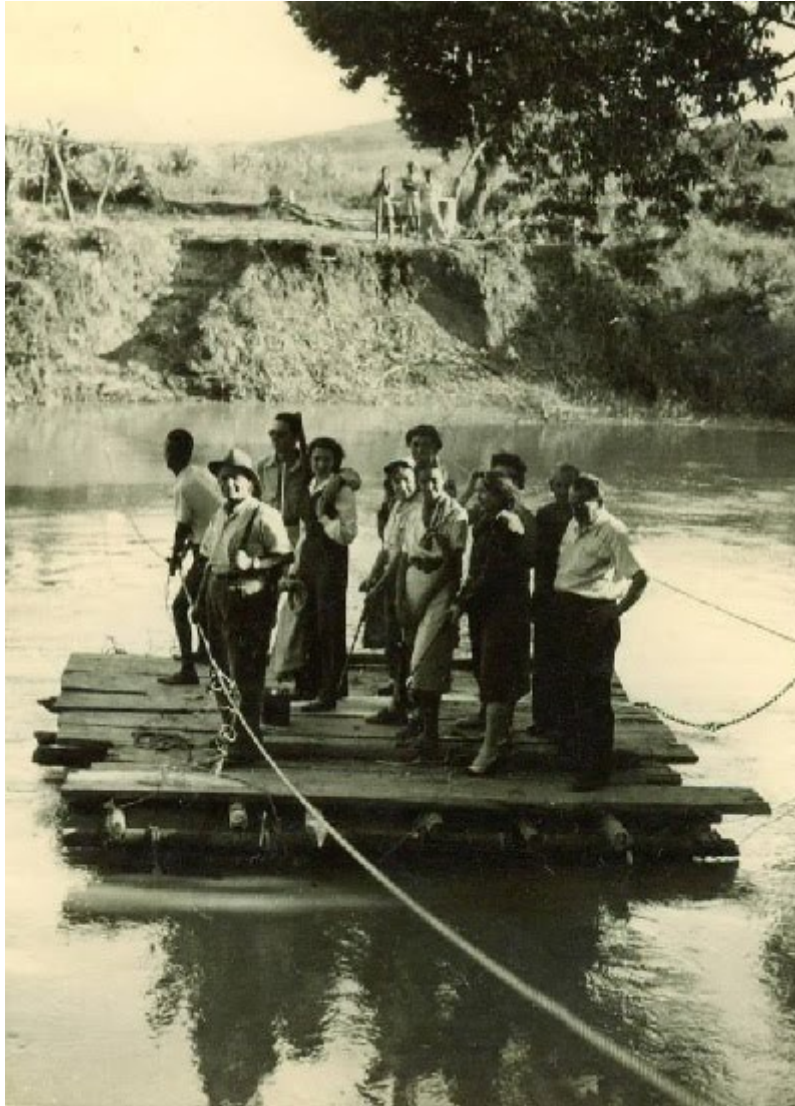
Η σχεδιά που πήγαινε στη Νέα Γη.

Στρίβαμε όπως έστριβε το ποτάμι με τις φιδίσιες του γραμμές, και σε κάποια σημεία βρισκόμασταν τόσο κοντά σαν να έγινε βάρκα το αυτοκίνητο και εμείς πλέαμε συμμετέχοντας σε αυτό το ξέφρενο πανηγύρι. Φθάσαμε στη Νέα Γη. Σταματήσαμε και θαυμάσαμε.