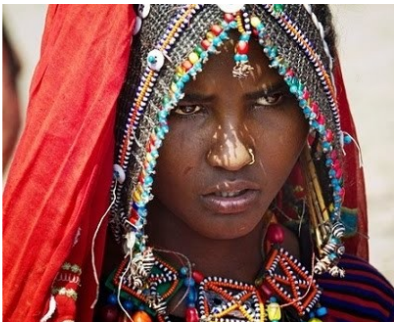
Γυναίκα από την φυλή των Αφάρ.

Ενα κεφάλαιο που αποσκοπεί να ξεκουράσει τον ευγενικό αναγνώστη ενώ μια βαθιά χαρά κατακλύζει το πλούσιο στήθος της συγγραφέως.