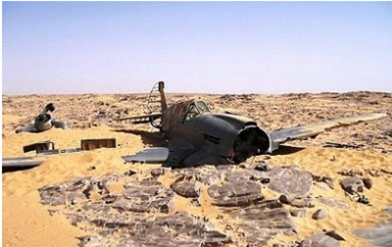
Συντρίμμια αεροπλάνου στην έρημο.

Κάτι θρόισε μέσα στην καρδιά μου. Μια νοσταλγία για την Νατάσσα και συγχρόνως μια λύπη για αυτή την άγνωστη μελαψή που πριν προλάβω να γνωρίσω έπρεπε τόσο άκαρδα να αποχωριστώ εξ αίτιας ενός ανέμου. Ίσως ποτέ να μην την έβλεπα ξανά. Καθώς χάθηκε σαν μικρή κουκίδα μέσα στη θάλασσα της άμμου ένα ξαφνικό σκίρτημα στη καρδιά μου με έκανε να αντιληφθώ την παρουσία του Λί.