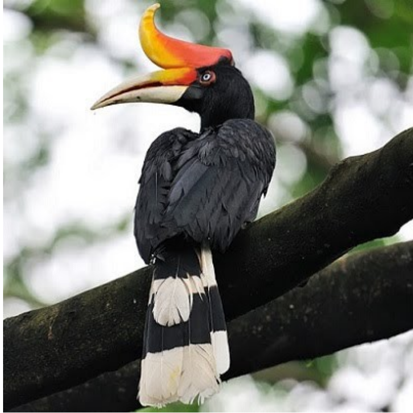
Βούκερος ο ρινόκερος, με το τεράστιο κυρτό κέρατο.

Και για να δούμε τι καλά μας έφεραν είπε ο αρχηγός περιπαικτικά.