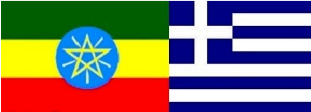
Οι σημαίες της Αιθιοπίας και της Ελλάδος

Όπου μέσα από το χιούμορ και τη χάρη του Κεντίρ αναβλίζει σαν γάργαρα νερό η λύση για τα προβλήματα του ηρώα μας.