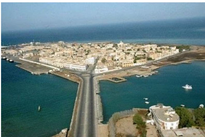
Η Μασσάουα, ένα μεγάλο λιμάνι στην ερυθρά θάλασσα.

Όπου το αναπότρεπτο της μοίρας και του έρωτα συναντώνται για να επιτελέσουν το μέγα τους έργο. Αλλωστε όσα και να γραφτούν, όσο κοινότυπα και να φαίνονται τα λόγια για τον έρωτα ηχούν πάντα καινούργια.