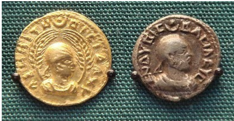
Νομίσματα του Αξούμ, με επιγραφές στα αρχαία ελληνικά.

Ακολουθεί μια σύντομη αναφορά στη σχέση Αιθιοπίας- Ελλάδος. Ένα κεφάλαιο που η μούσα της ιστορίας χαρίζει στον ευγενικό αναγνώστη που θα ήθελε να ενδριβήσει σε παραπλήσια θέματα και ενδεχομένως να μη ξέρει από που να βρει την άκρη.