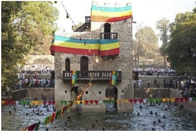
Το Τμκάτ, τα Θεοφάνια των Αιθίοπων στο Γκόνταρ.

Ένα περιηγητικό και καθαρά ταξιδιωτικό κεφάλαιο όπου περιγράφονται οι ξεναγήσεις στις ιστορικές πόλεις Γκόνταρ, Λαλιμπέλα και Αζουμ σε συνδυασμό με τη μυθολογία, την τωρινή κατάσταση της χώρας, και τις ενδιαφέρουσες πληροφορίες για την χαμένη κιβωτό της Διαθήκης.