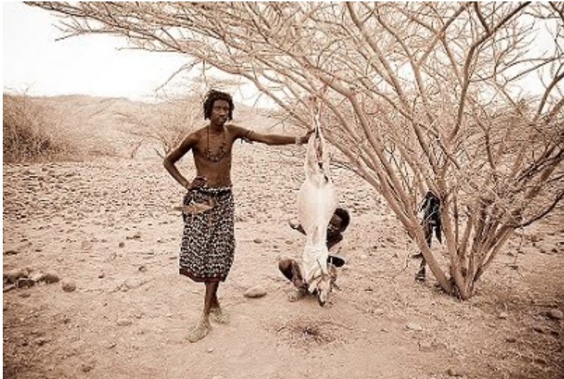
Οι Ντανκάλοι (Αφάρ), άγριοι, τραχείς, φοβεροί και αυτοί σαν τη γη τους

Ερυθρά θάλασσα και το φημισμένο ριφτ -βαλλευ. Περί αστέρων που δεν καταγράφονται σε χάρτες, ονειροπολημάτων και άλλων τρυφερών εκπλήξεων. Οπου ήρθε η ώρα να μάθει ο υπομονετικός αναγνώστης από τον Λή, πως κάθε γεγονός που μας συμβαίνει όχι μόνο δεν είναι τυχαίο, αλλά προσχεδιασμένο να συμβεί και αφού συμβεί πυροδοτεί και άλλα γεγονότα που όλα μαζί σε σύνολο συνεργάζονται για την αφύπνιση μας.