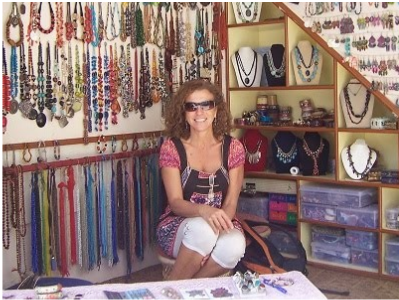
Η συγγραφέας του μυθιστορήματος Μαίρη Μεταξά – Παξινού