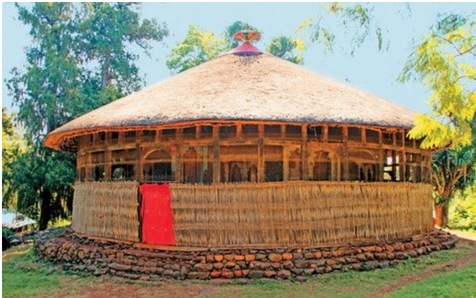
Η κυκλική εκκλησία της Κιντάνε Μεχρέτ με την αχυροσκεπή.

Είδαμε τις πρώτες αγέλες από ζέβρες να τρέχουν, και ανάμεσά τους όλων των ειδών τα ελάφια, ιμπάλα, και καμηλοπαρδάλεις. Κόψαμε στροφές, αφήσαμε το γκάζι, και κατεβήκαμε με τη μύτη του αεροπλάνου. Τραβήξαμε το τιμόνι πίσω και γκαζώσαμε με τον μοχλό για να κρατηθούμε σε ένα οριζόντιο ύψος. Ξεχωρίσαμε τους πρώτους κροκόδειλους και τους ιπποπόταμους. Μια ζεστή δεσμίδα φωτός από χρυσές ακτίνες του ήλιου διέλυσαν τα σύννεφα για να αποκαλύψουν μπροστά μας την θεόρατη λίμνη Τάνα. Τη γαλάζια κυρία. Πετώντας πάνω από τους καταρράκτες της η αντανάκλαση τύφλωσε τα μάτια μας.