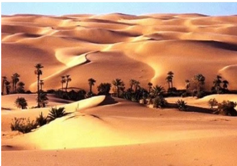
Όαση στην Έρημο.

Όπου ο ήρωάς μας αναρρώνει και καθώς ο έρωτας στήνει τις παγίδες του, του αποκαλύπτει κρυφά και αδιότατα μυστικά.