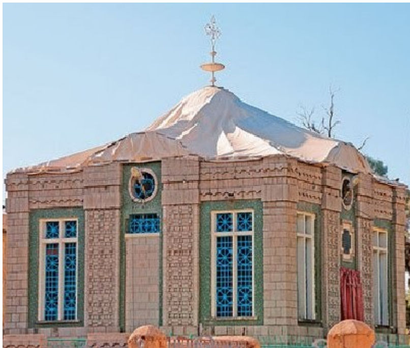
Η Παναγία της Σιών, εικάζεται ότι εκεί φυλάσσεται ηΚιβωτός της Διαθήκης.

Ανθρωποι φιλόξενοι, καλόκαρδοι και ευγενικοί. Τους θυμάμαι πάντα με την ίδια ζεστασιά και νοσταλγία.