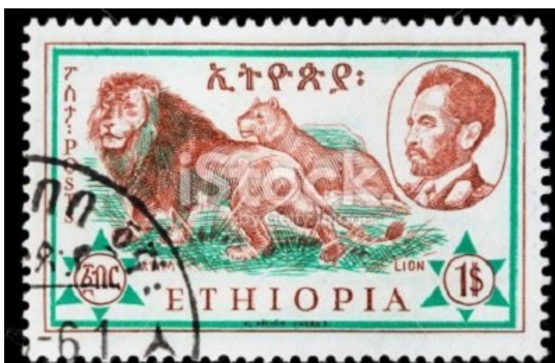
Γραμματόσημο επί των ημερών του Χαιλέ Σελάσιε.