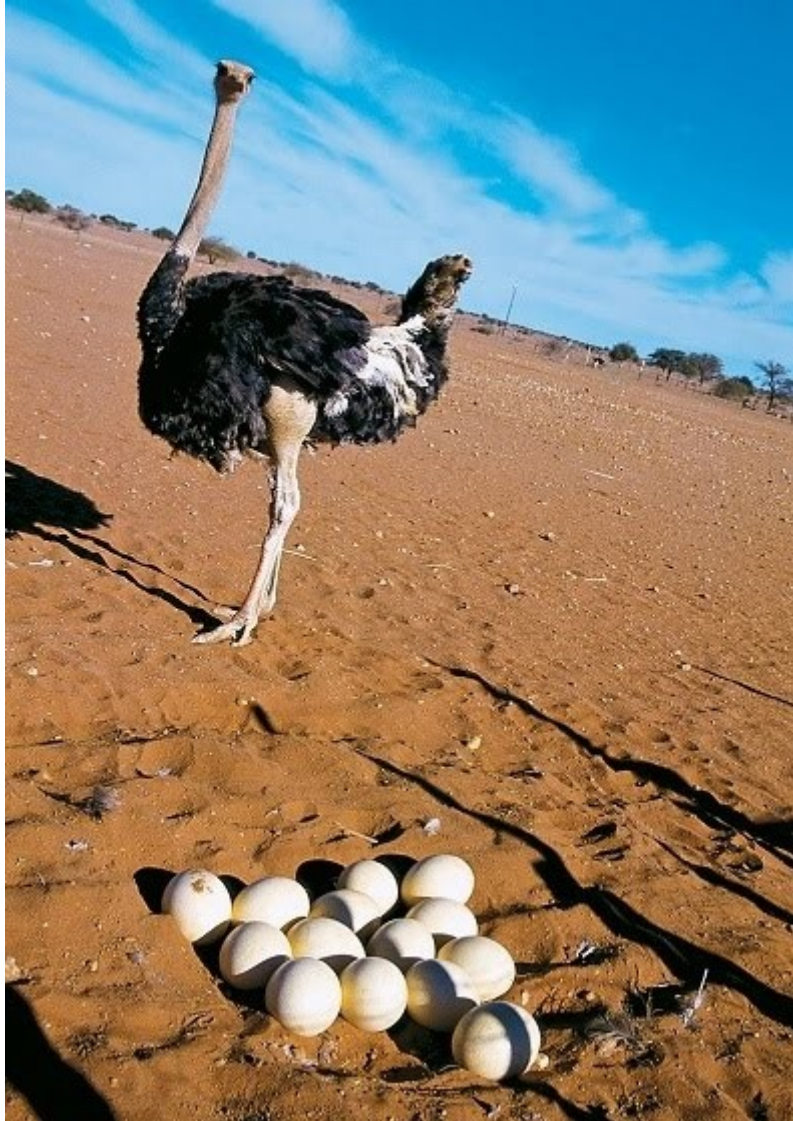
Στρουθοκάμυλος με τα άσπρα της αυγά

Παιδική παραπομπή. Περί τερμιτών, μυρμηγκοφωλιών αυγών και μυστικής συμφωνίας του μικρού μας ήρωα με την στρουθοκάμηλο Ερμιόνη. Περί ιπποπόταμων, κληρονομημένων συνηθειών, και ιστοριών της Καλής τις οποίες ο αυθόρμητος αναγνώστης θα απολαύσει αλλά και θα πάρει μια ιδέα για το τι πίστευε η ίδια για τον Λή.